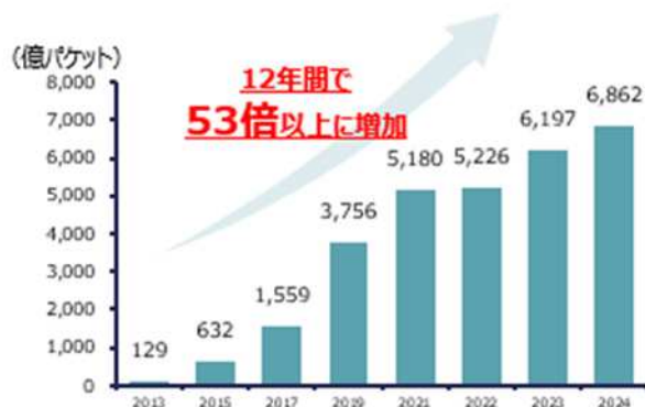
国内でのサイバー攻撃関連の通信量の推移