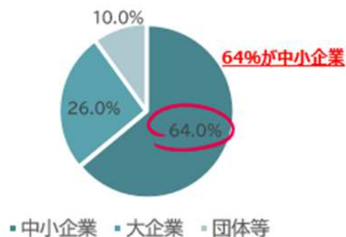
ランサムウェア被害企業等の規模別割合