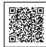
※QRコードは株式会社デンソーウェブの登録商標です。

なお、ご契約内容変更をご希望の方は、別途「契約内容変更依頼書」のご提出が必要となります。上記URLに掲載の「契約内容変更依頼書」にご記入、ご捺印の上、代理店までご送付ください。